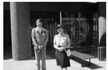
写真3 お世話になりました